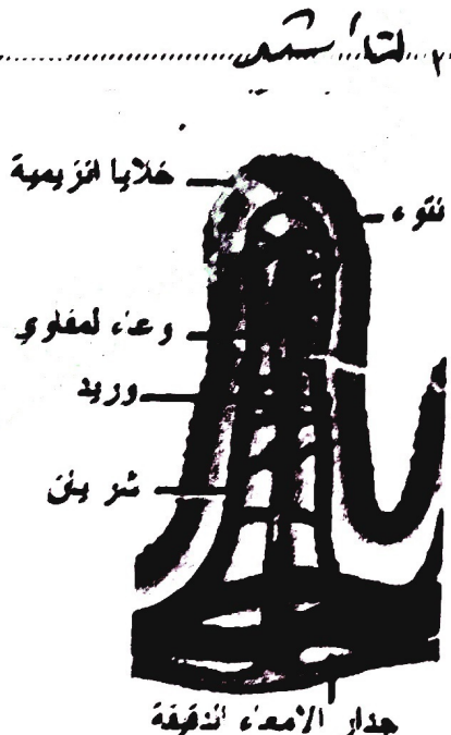
شكل (40) الزغلبة